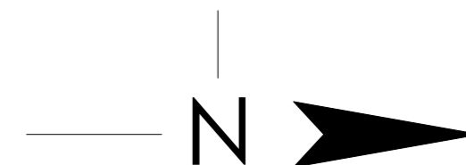
RZUT KONDYGNACJI Z ZAZNACZENIEM LOKALU MIESZKALNEGO