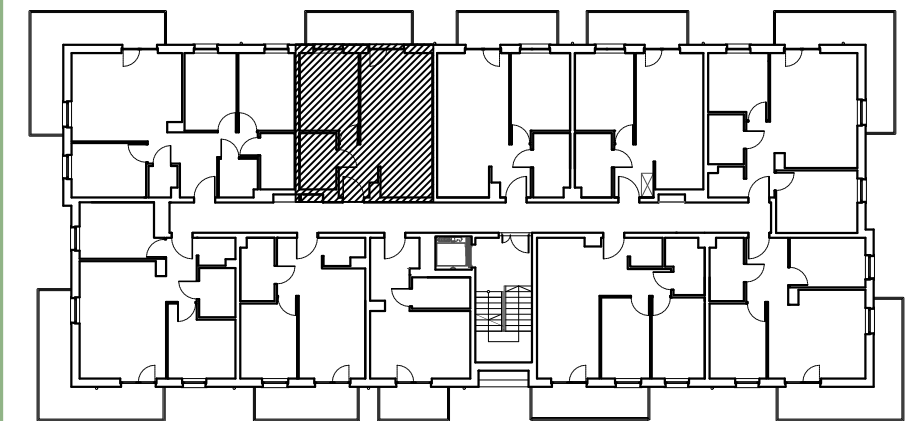
RZUT KONDYGNACJI Z ZAZNACZENIEM LOKALU MIESZKALNEGO

ELEMENTY STAŁE ŚCIANY Z MOŻLIWOŚCIĄ DEMONTAŻU